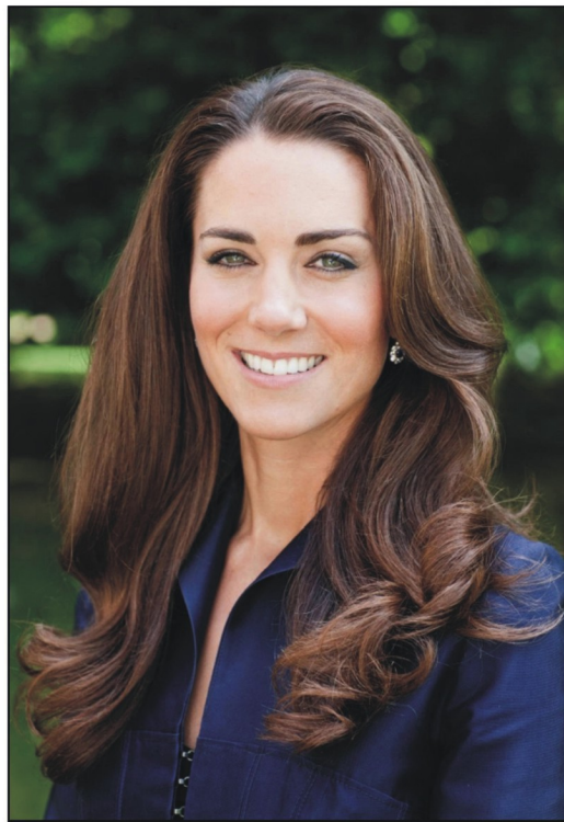
Alteța Sa Regală Catherine, Ducesă de Cambridge