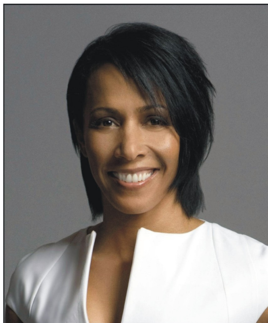
Dame Kelly Holmes, dublă campionă olimpică