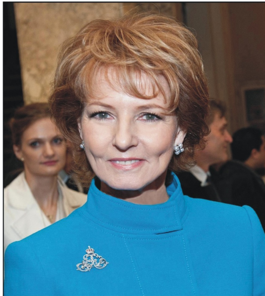
Alteța Sa Regală Principesa Moștenitoare Margareta a României