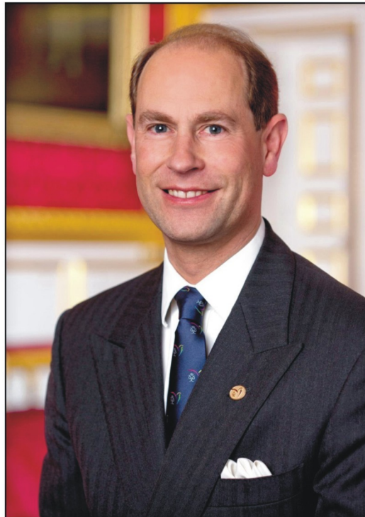
Alteța Sa Regală Prințul Edward, Conte de Wessex