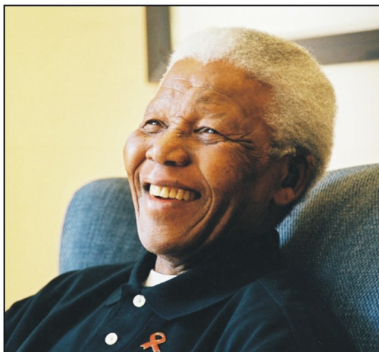
Nelson Mandela, fostul președinte al Republicii Africa de Sud